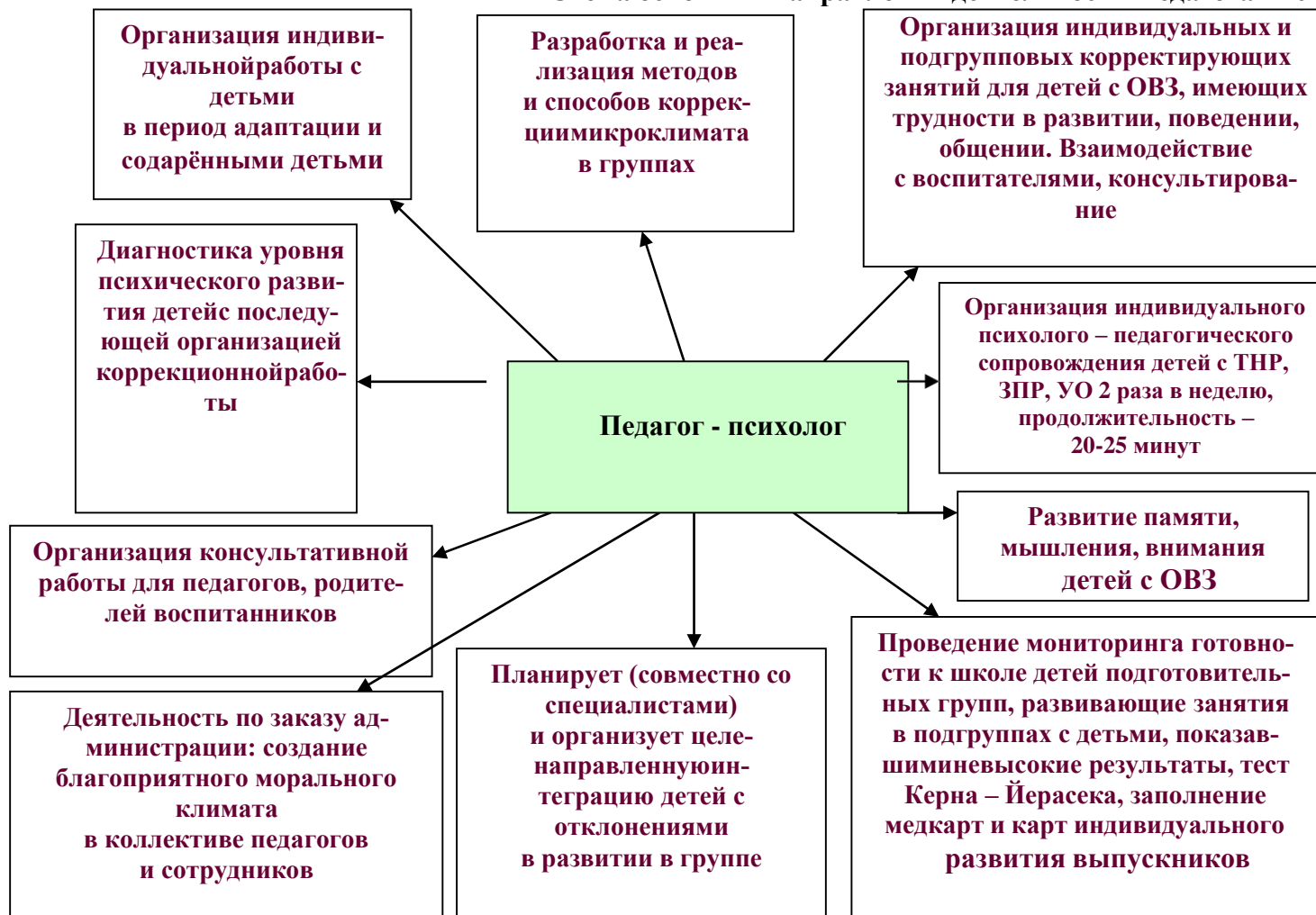
Схема основных направлений деятельности Педагога - психолога,

В коррекционной развивающей работе применяются: Метод Су-Джок терапии